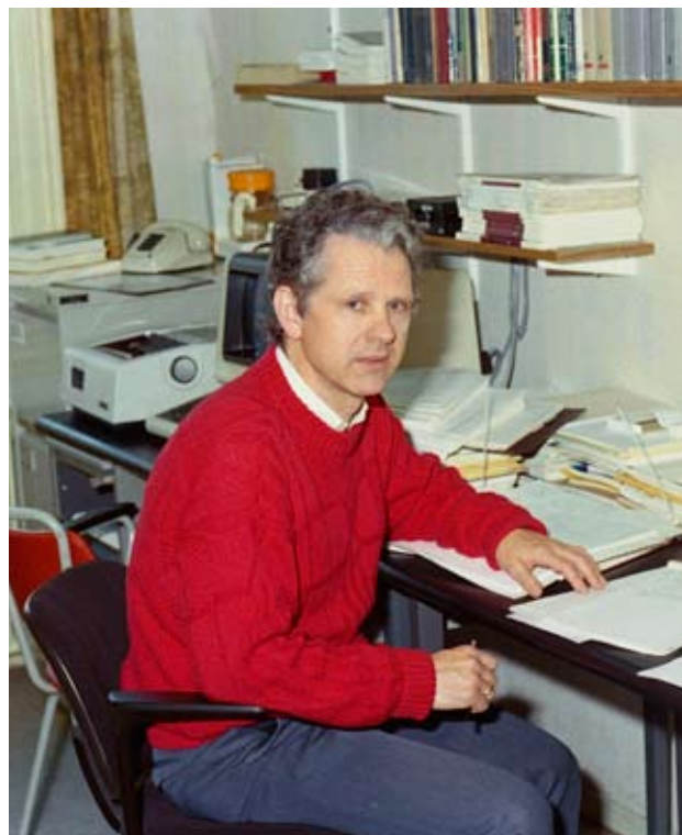
Aan zijn bureau in het kasteel (1988)